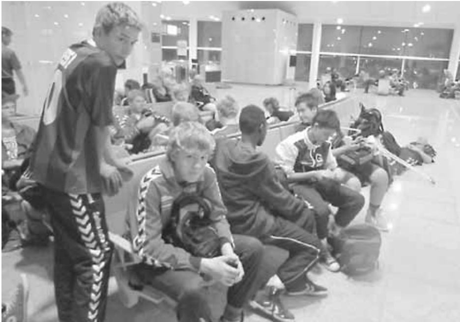
Ventetid i lufthavnen.