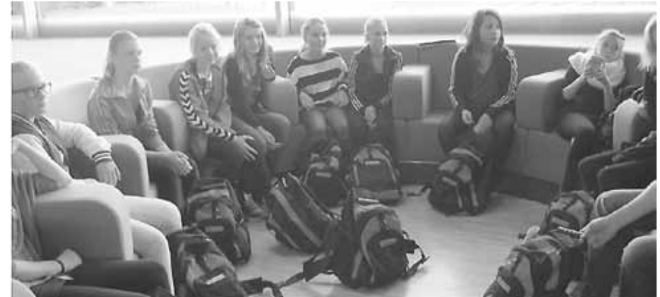
Ventetid i Amsterdam lufthavn