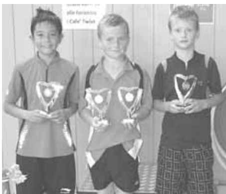
Mads med to pokaler i samme stævne.

Også i år er der flotte resultater for ung-