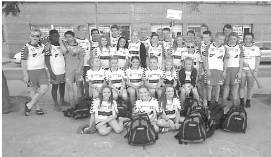
Spændte drenge og piger er ankommet til Spanien.