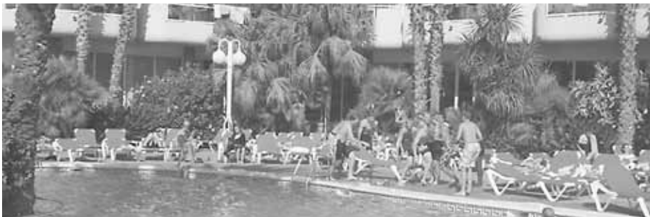
Der hygges ved poolen.