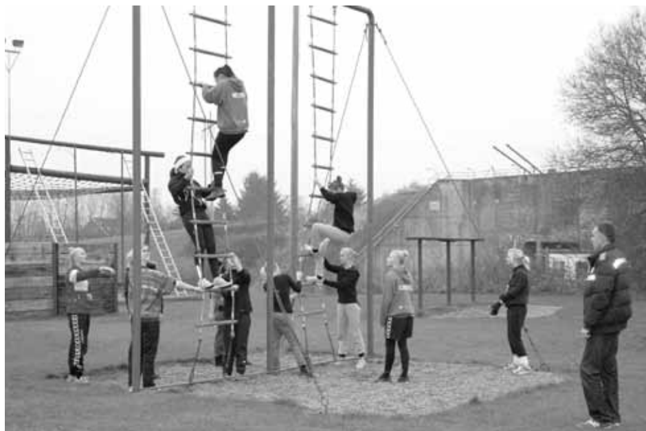
Her mødte pigerne den første forhindring på banen.