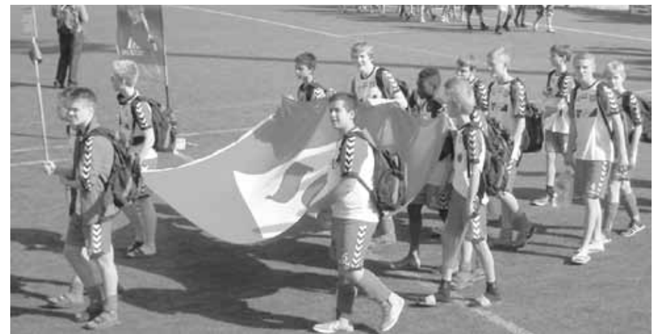
Indmarch på stævnestadion.

obligatoriske vandflaske og dagens madpakke samt andre fornødenheder var den også medvirkende til, at vi ledere nemt kunne holde øje med hvor vore unge mennesker befandt sig, både når vi var til kamp, men også når vi var på mere "kulturelle" escursioner, som Ramblaen og selvfølgelig til Champions League kamp på Camp Nou – tak til Sparekassen Østjylland.