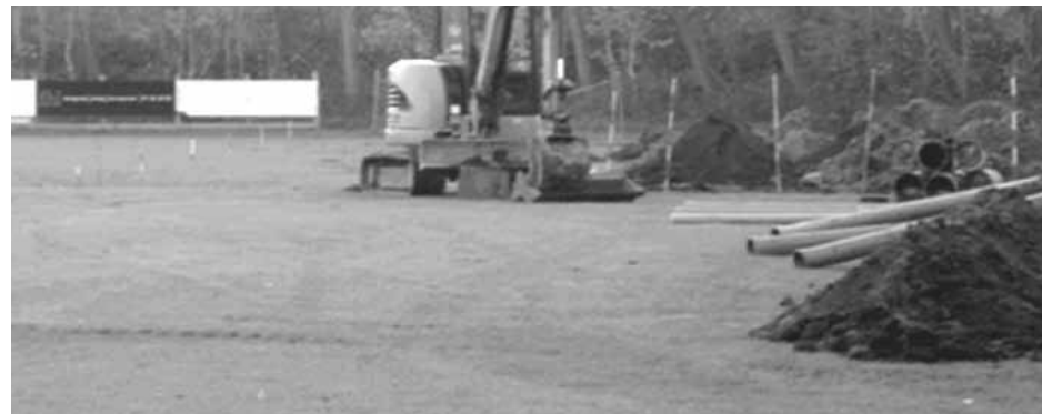
Det nye stadion forventes at være klar til foråret 2013.