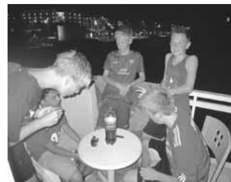
Aftenhygge på altanerne.

Herefter stod resten af turen på hygge og opbakning af pigerne som stadig var med i turneringen, vi nød tirsdagen med masser af badning både i poolen og ved stranden, efter vi havde set pigerne spille deres sidste kampe om tirsdagen, vi nød