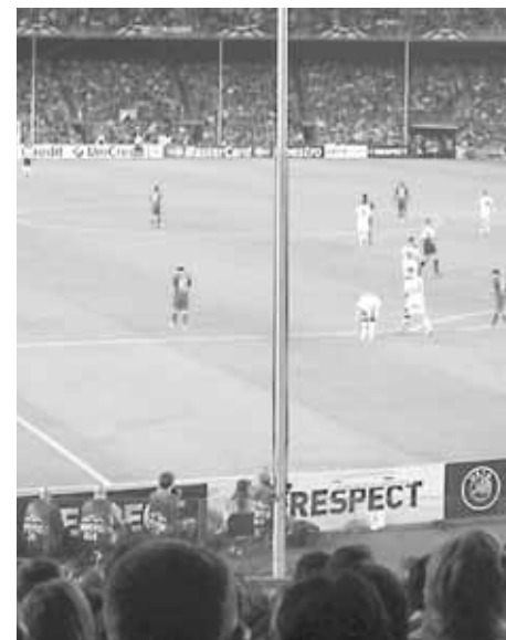
Barca Barca Barca.

Vi tog tidligt derind for at få hele stem- ningen med og det fik vi. Vi gik rundt i området ved stadion og så da spillerbus- sen kom med FCB spillerne, vi så hvor- dan området blev fyldt op med fans og fik et indtryk af hvor meget 75.000 fylder foran stadion. Alt i alt en stor oplevelse at slutte turen af med, iøvrigt vandt FCB 2-0 uden Messi scorede, men vi så ham trylle.